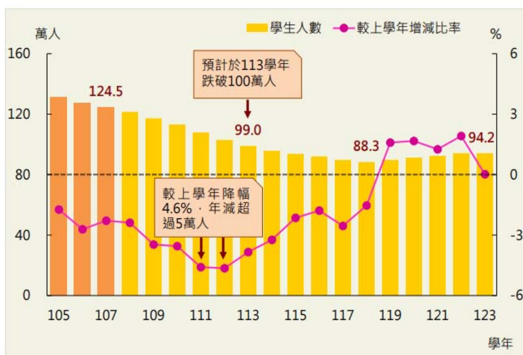
圖 1：我國大學大專校院學生人數預測(教育部，108 年 5 月)

我國高等教育雖日趨普及，但對應之學齡人口卻受到少子女化現象的衝擊，呈現下降之勢。依據教育部 108 年 5 月「大專校院學生及畢業生人數預測分析報告 (108~123 學年度)」，大專校院學生人數推估於 113 學年跌破 100 萬人，118 學年降至 88.3 萬人谷底，以 118 學年與 107 學年相比，降幅達 29.0%，平均年減 3.1%，其中以 111 學年學生人數年減 5.2 萬人最多，主因受學士班學生人數大幅減少影響，109~112 學年各年減超過 4 萬人，113 學年亦減近 4 萬人；119 學年起學生數觸底回升，推估 123 學年將走高至 94.2 萬人。大專學生人數當中，學士班占大宗且首先遭受少子女化之衝擊，107 學年 96.2 萬人，推估逐年遞減至 118 學年 65.2 萬人，累計 12 年間減幅為 32.2%，減少 30.9 萬人。在此種少子化趨勢與高等教育擴充政策相交乘之下，我國高等教育面臨生源不足挑戰與考驗。