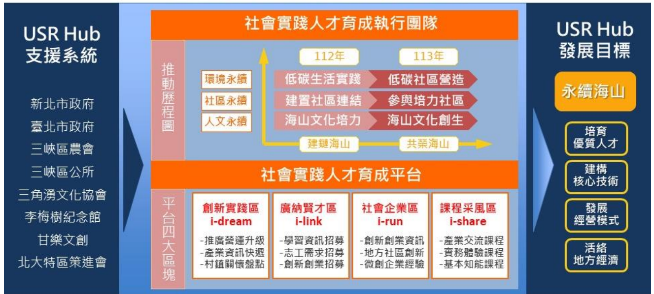
本校校級大學社會責任實踐基地(USR Hub,i-Can)永續運作之基礎推動架構圖

經 108 年底 USR 實踐推動委員會議通過，本校將設置校級大學社會責任實踐基地（USR Hub,i-Can），規劃本校行政大樓 B1（原餐廳）空間，規劃有基地空間軟硬體設置、提供社會實踐與創新創業人才育成平台、建置社會實踐與創新創業課程空間、辦公室設置等空間。主要提供各 USR 計畫交流互動場域，作為支持萌芽型計畫強力後盾，並藉由密切交流連結，協助育成種子型計畫，同時提出多項支持 USR Hub 運作之具體制度、永續經營機制等。111 年完工及舉行揭牌儀式，室內空間 576 平方公尺，戶外空間 800 平方公尺，總面積為 1,377 平方公尺，合計約 417 坪，可容納 80 人至 100 人。實踐基地的設立，除了作為 USR 辦公室之外，目前亦提供師生與校外公、私部門人士進行社會責任實踐議題的討論、研究、發表及講座之用，本校藉由 USR Hub 作為平台，致力於在地創生與人才培育，促進社區與大學共榮發展，讓實踐基地成為履行大學社會責任的奠基石，展現 USR 學校支持。